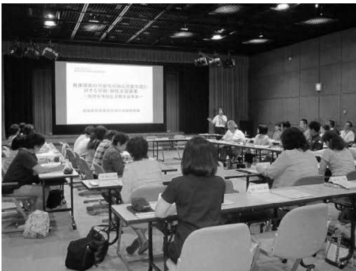
写真Ⅱ－1 平成29年度第1回藍住町特別支援地域連携協議会

このため、事業所と学校の連絡担当者名を記した名簿の交換など、簡易な実施方法の工夫が必要である。資料5に示した書式は、市町村の教育委員会が、各学校・園の連絡担当者名を事業所に提供するとともに、事業所に対して連絡担当者名の提供を求めるものである。放課後等デイサービス事業所と学校の連携を進めようとする教育委員会等には、是非御活用いただきたい。