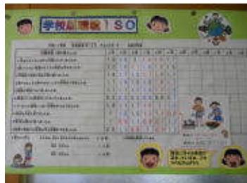
【ISOチェックカード（児童用と教師用）】