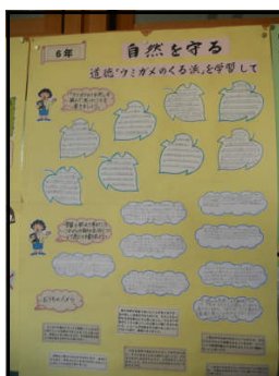
【ウミガメの来る浜】