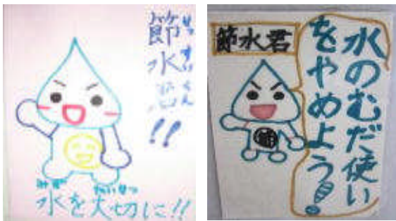
美化委員会が作った「節水ポスター」