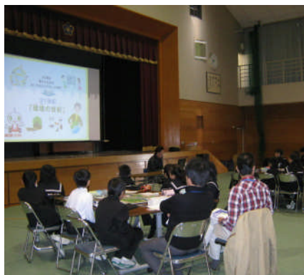
トヨタ原体験による環境学習