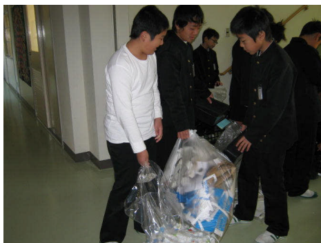
委員会活動による回収