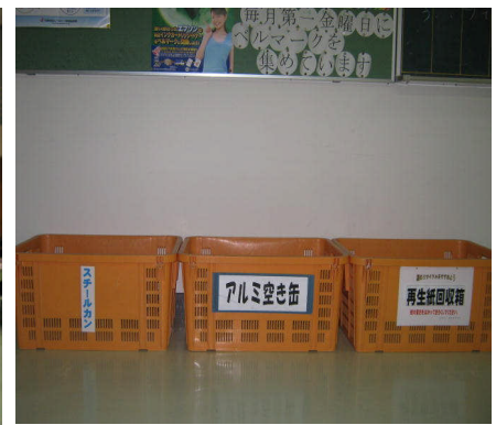
資源ゴミ回収ボックス