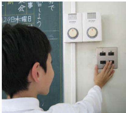
照明をこまめに消す