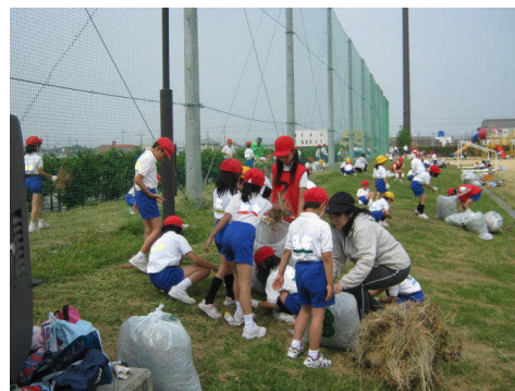
全校児童での北村公園の清掃