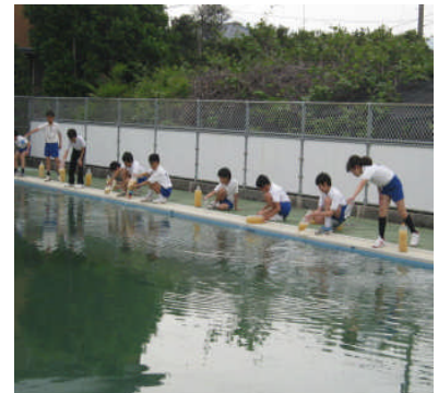
プールにEM発酵液投入