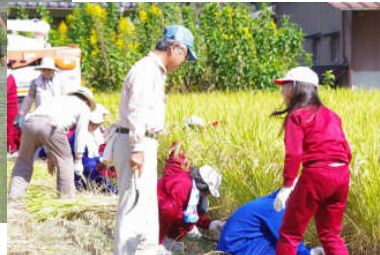
保護者や地域の方に協力 していただいたの米作り