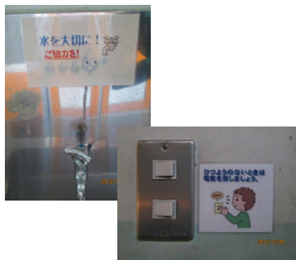
エコ呼びかけ表示