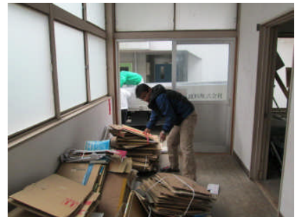
地域にも呼びかけて古紙回収