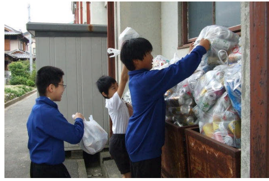
毎月末のごみゼロの日・・・家庭や地域の空き缶回収を行う