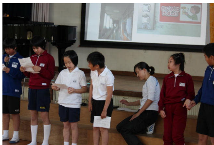
集会でみんなへの呼びかけ