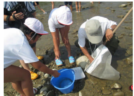
水生生物・水質調査の学習