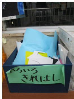
各教室や職員室で紙資源を大切に