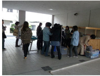
制服リサイクル活動