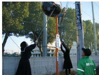
カーブミラー磨き