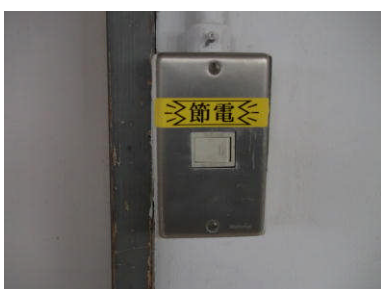
使用しない教室やトイレの消灯を節電シールで呼びかけている