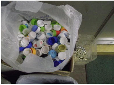
ペットボトルキャップとプルタブ回収