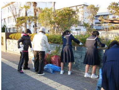
クリーンアップ大作戦