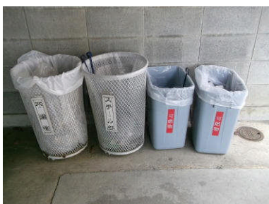
整頓された分別ボックス