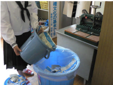
毎日、牛乳パックをひらいて 洗浄・乾燥してリサイクル