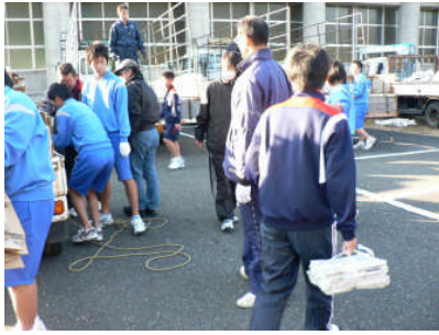
保護者の方も協力いただき 資源回収