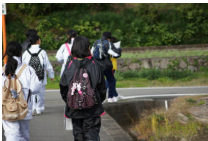
オリエンテーリングをしながら 道路の美化活動