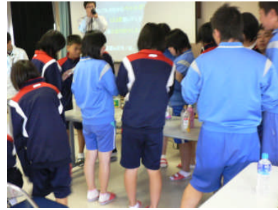
「環境学習講座」で資源の 分別の実習