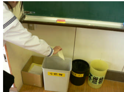
ゴミを可燃物・不燃物・ プラスチック類・再生紙に分別