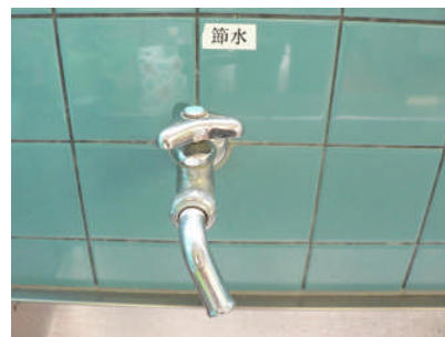
すべてのスイッチ・水道に「節電」「節水」を表示し意識付け