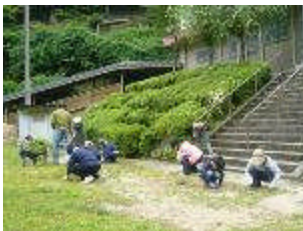
親子奉仕作業の様子（6月）