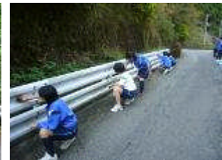
通学路のガードレール清掃作業の様子