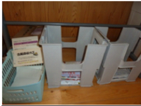
新聞・チラシ・本・段ボールに分別 コピーのミスなどの古紙回収（リサイクル）

廊下で缶・びん・燃えないゴミ・ペットボトル・燃えるゴミ・割れたガラス・乾電池に分別