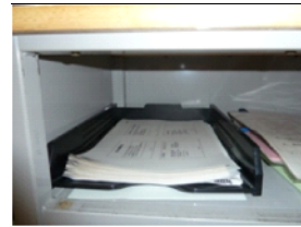
裏紙が利用できるように，各教室の 教卓に入れ物を設置し，古紙回収に 協力