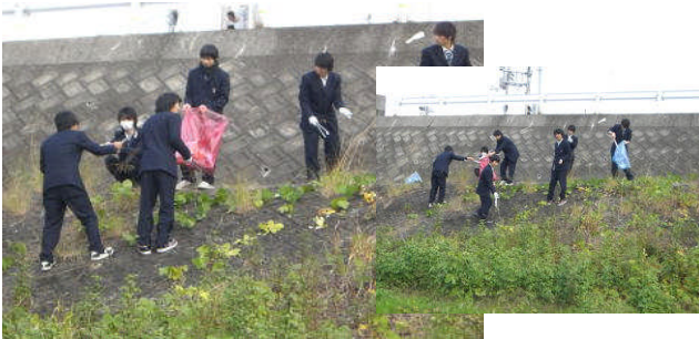
鮎喰川河川敷の清掃奉仕活動