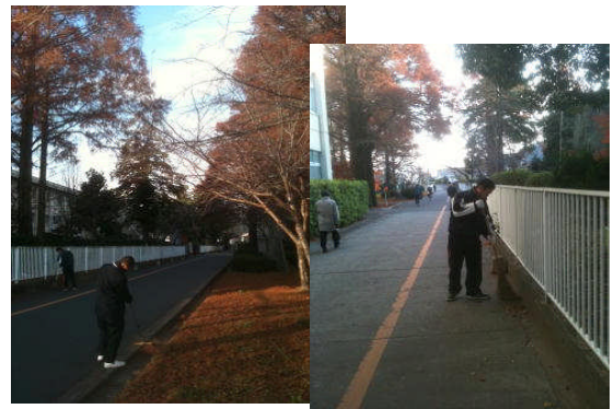
運動部や生徒会役員による学校周辺の清掃奉仕活動