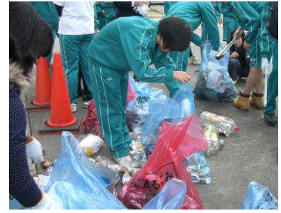
袋井用水の清掃奉仕活動