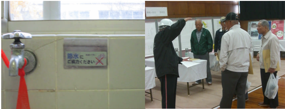
校内の水道栓、電灯スイッチ付近にエコプレートを貼った 地域防災訓練（11月9日）において、地域の方々にエコプレートを配布した