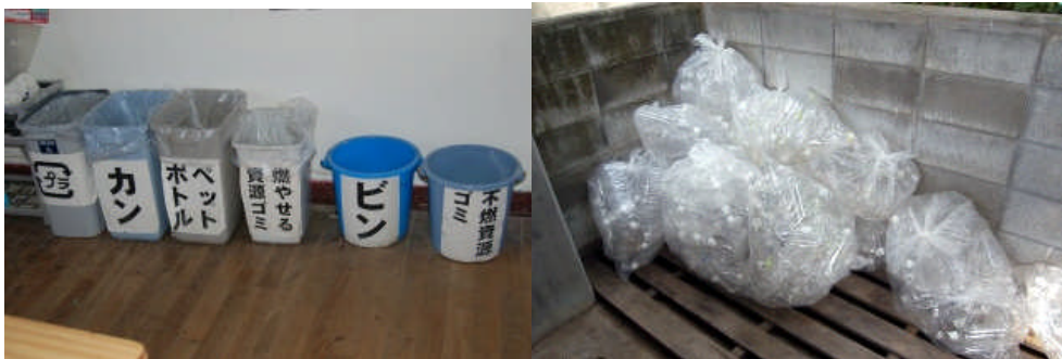
分別回収箱の整備