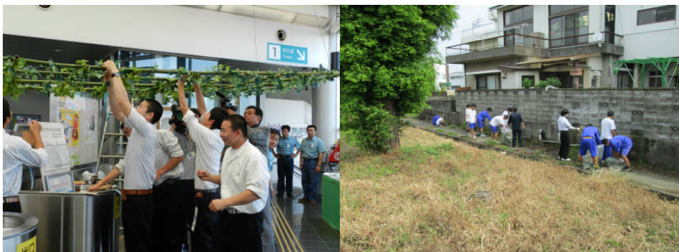
生徒会生徒による阿南駅清掃