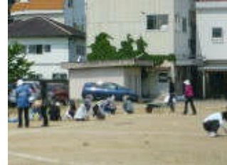
P T A 清掃活動