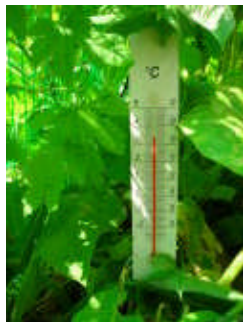
緑のカーテンの葉の表裏の温度差調べ