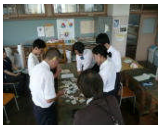
節水・節電カード作り