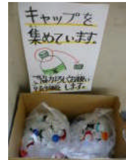
エコキャップ回収