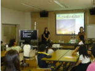
環境学習（地球温暖化）