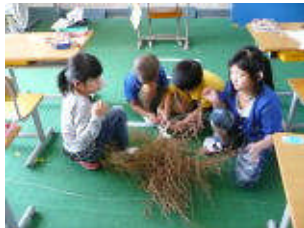
ほうき草の育成とほうきの作成