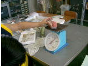
あずきカイロ作成