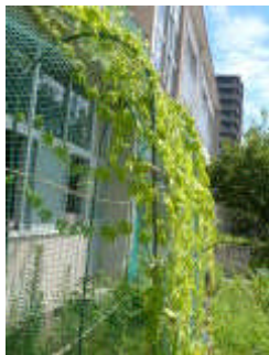
緑のカーテンの育成