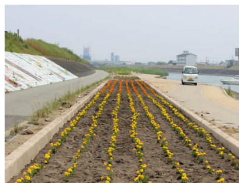
花の植栽(横見町河川敷花壇)