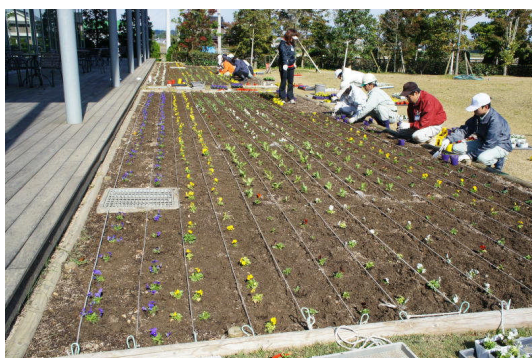
花の植栽(日亜化学工業)