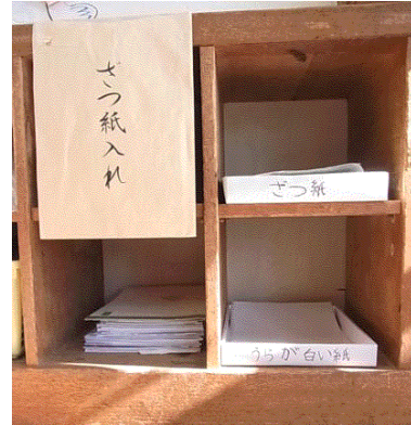
各教室に置かれた雑紙入れ