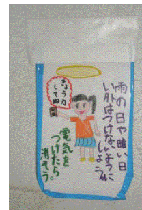
トイレの スイッチ カバー