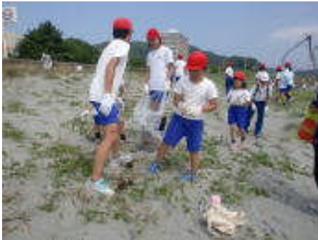
「竜宮の磯」の海岸清掃