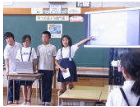
「竜宮の磯」生き物調べの発表