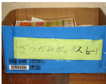
各学級の雑紙を集めるボックス