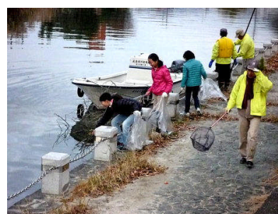
「正法寺川を考える会」の活動に参加