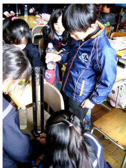
正法寺川の水の透視度検査