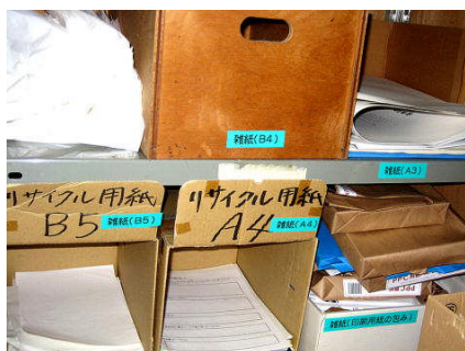
職員室のリサイクル用紙コーナー