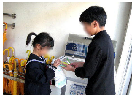
トレイの協力者に環境委員会から「ありがとうカード」の手渡し