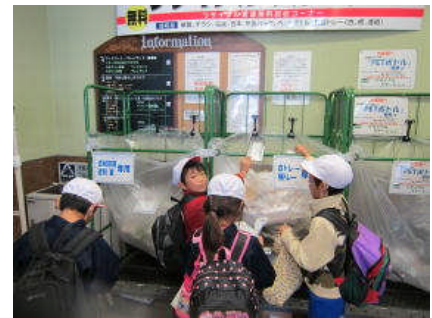
地域の資源ゴミ回収の体験