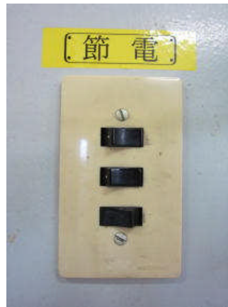
各スイッチに シール貼りや呼びかけを掲示