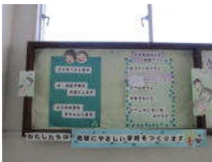
ISO コーナーの設置 (毎月の残食量を掲示)