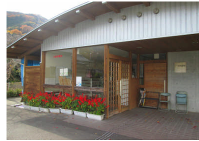
地域の環境を美しく（学校で育てた花を地域にプレゼント）