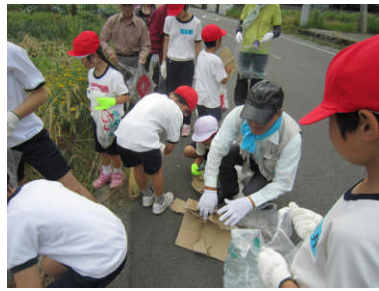
1回目（地域の方と共に）