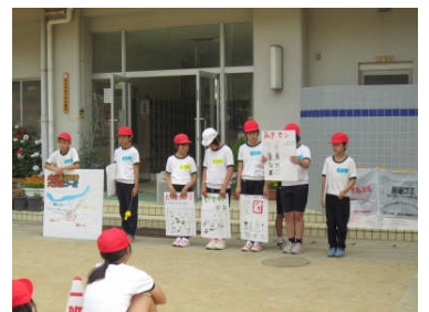
リサイクル活動（ごみの分別）