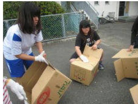
資源回収（6月） 段ボールの回収作業