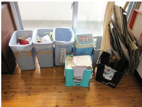
職員室のゴミ分別