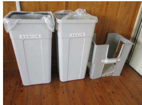
各教室のゴミ分別