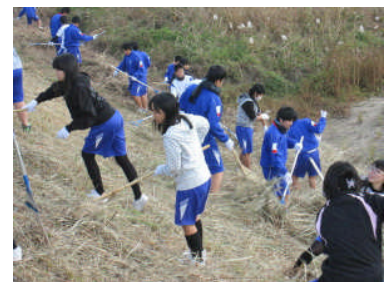
空き缶拾いと堤防除草（11月）