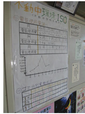
生徒会掲示板の「環境ISO」掲示