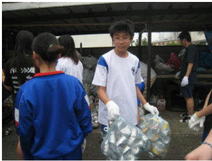
資源回収（6月） アルミ缶の回収作業