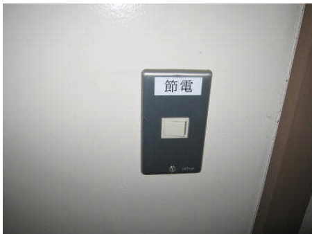
「節電シール」による呼びかけ