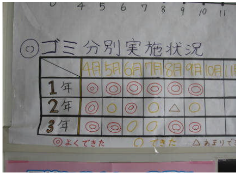
ゴミ分別実施状況の掲示