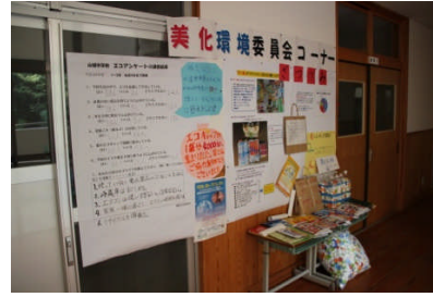
アンケート結果と愛のエコキャップ