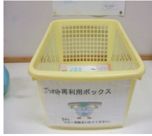
教室の「ごつがみ」入れ