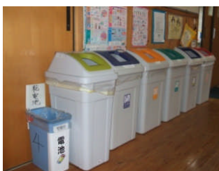
分別ゴミ箱の設置