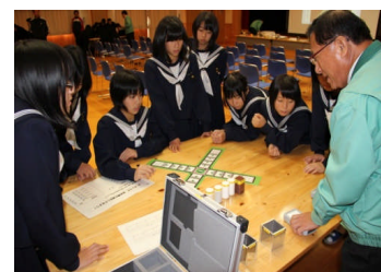
エネルギー環境教室