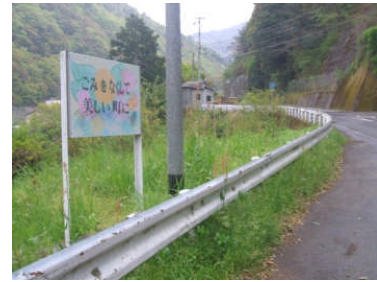
地域に看板の作成と設置