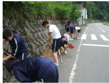
清掃ボランティア

全校生徒の「ゴミ0運動」 「愛校作業」以外にも、毎週 月曜日朝のボランティア清掃 を行っている。