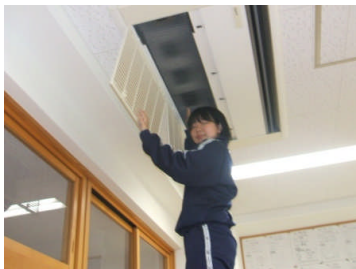
エアコンのフィルター清掃