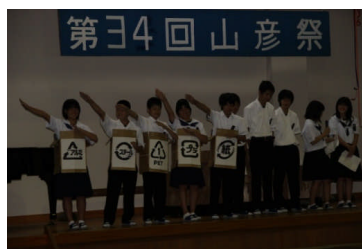
文化祭で分別の呼びかけ