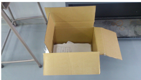
教室への「リサイクルボックス」の設置