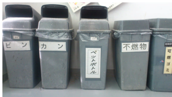
教室にラベルを貼付した分別のごみ箱を設置