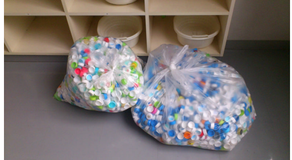
洗浄後のキャップ