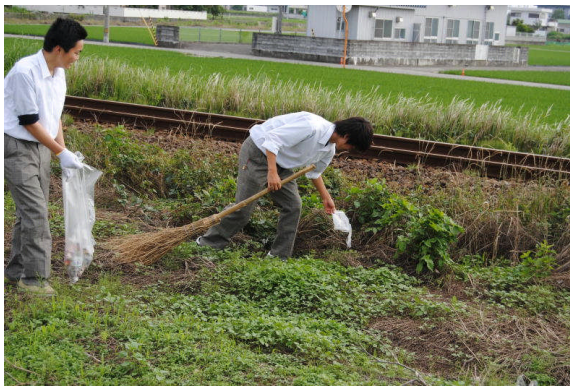
線路沿いの美化活動