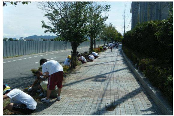
学校周辺植え込みの美化活動