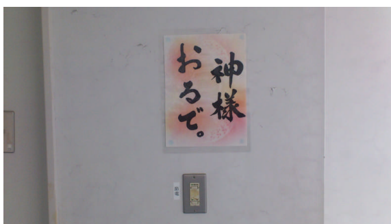
節電を呼びかける掲示物