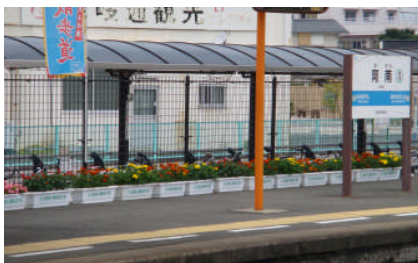
J R 阿南駅