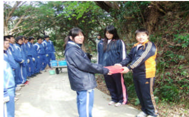
バイオ球根を伊島中学生へ