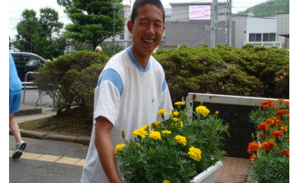
草花と共に笑顔も届けます