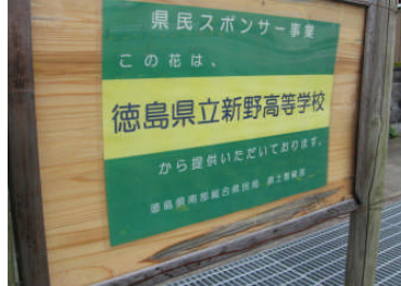
花苗県民スポンサー事業