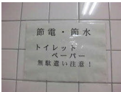
節電促すシールの貼り付け