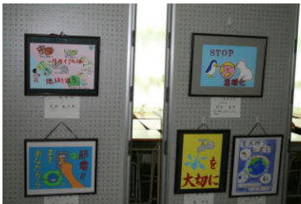
エコポスターの優秀作品