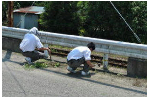
周辺の道路も除草等美化活動実践中