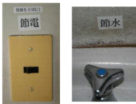
各所の電気水道の注意喚起