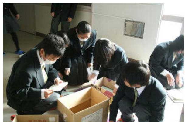
各クラスで集めた雑紙はまとめて業者へ