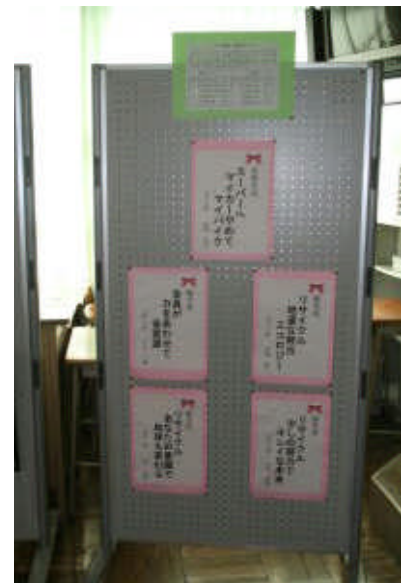
エコ標語部門の優秀作品