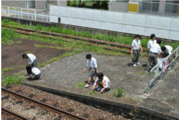
毎学期期末考査最終日に実施