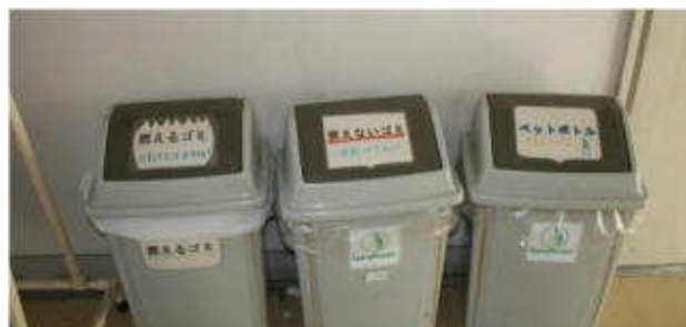
校内各所にゴミ箱を設置